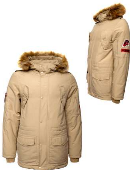
Куртка зимняя утеплённая бежевая с капюшоном и отделкой к капюшону из искусственного меха коричневого цвета